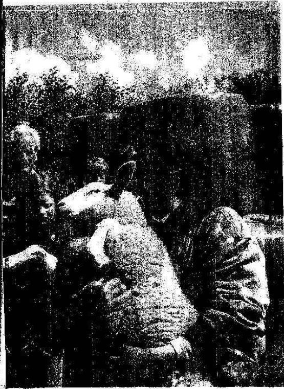
...gelijkertijd een stuk heden en verleden.